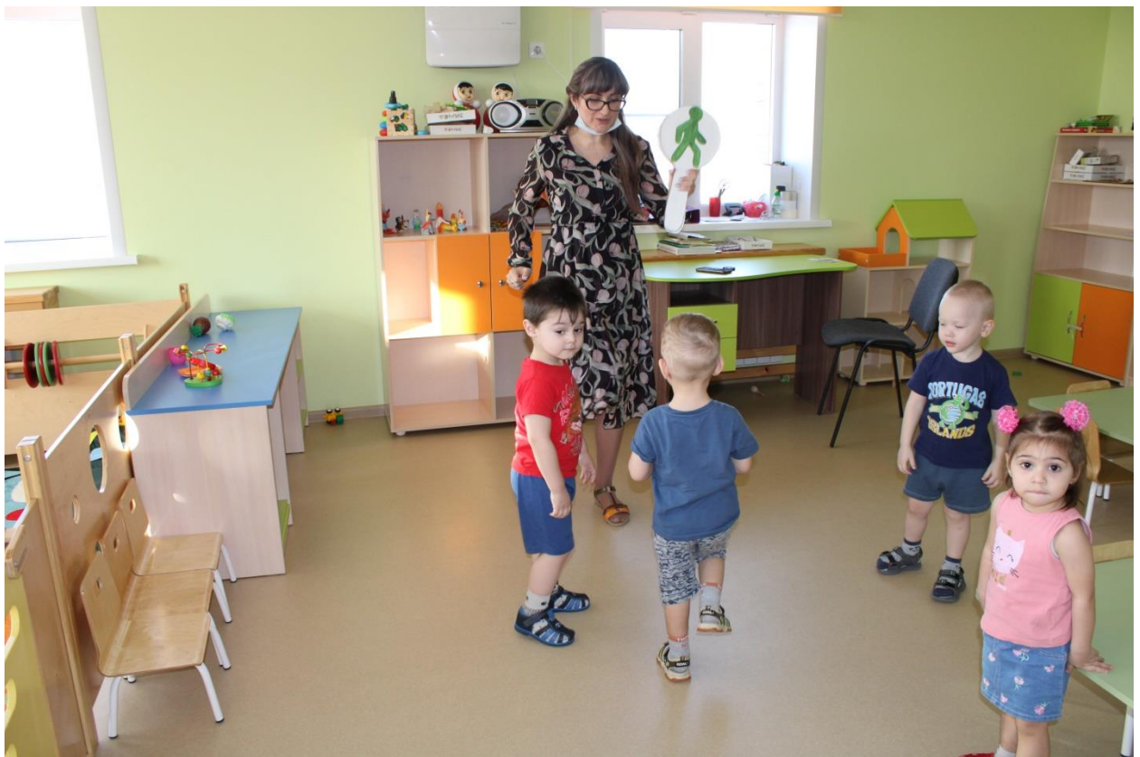
Игра со знаками