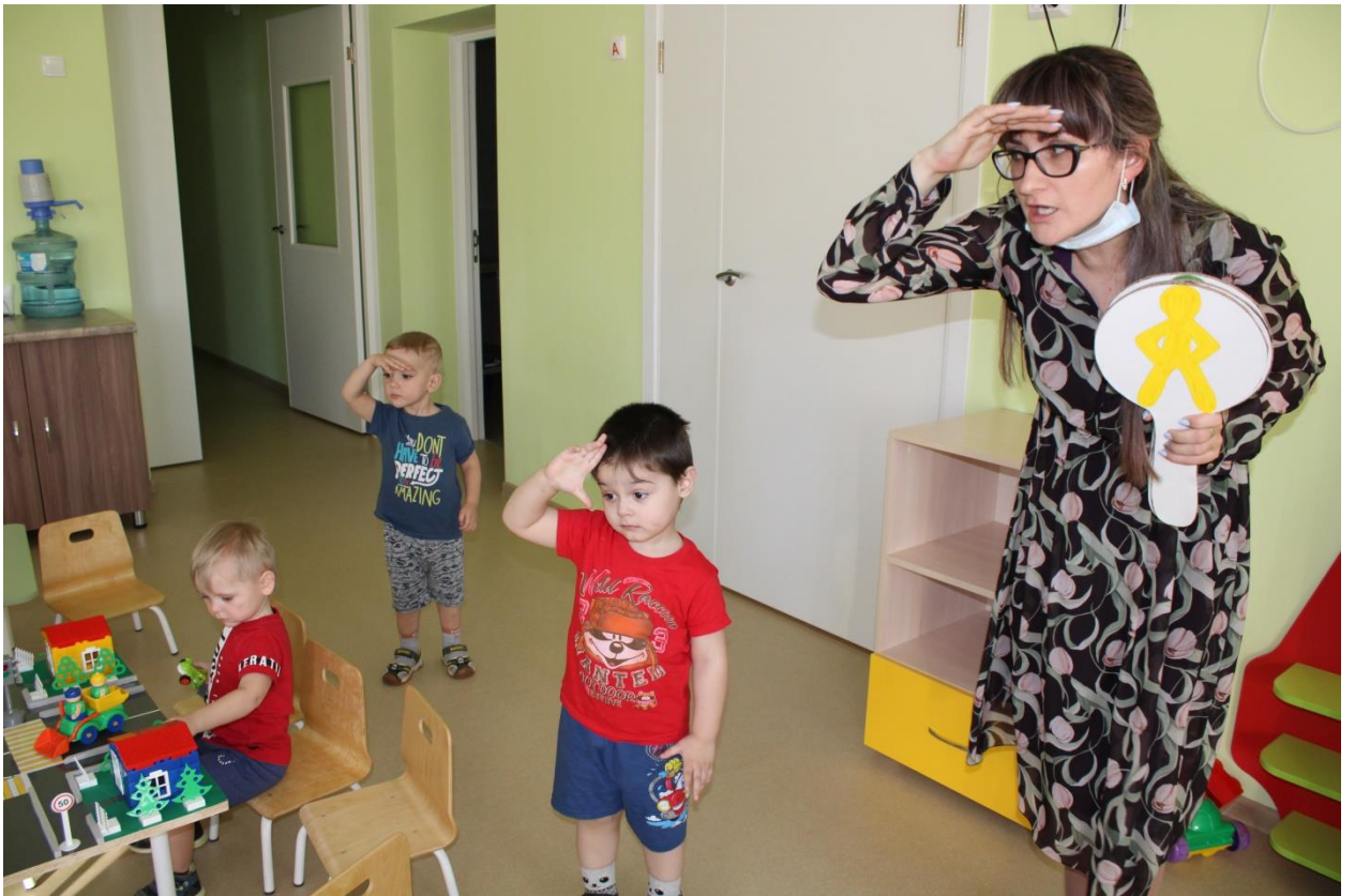
Игра со знаками