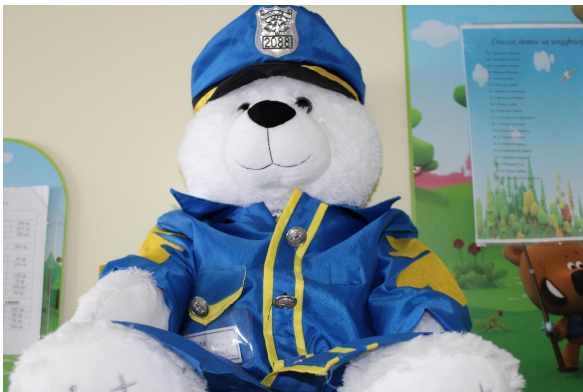
Полицейский Костя медвежонок