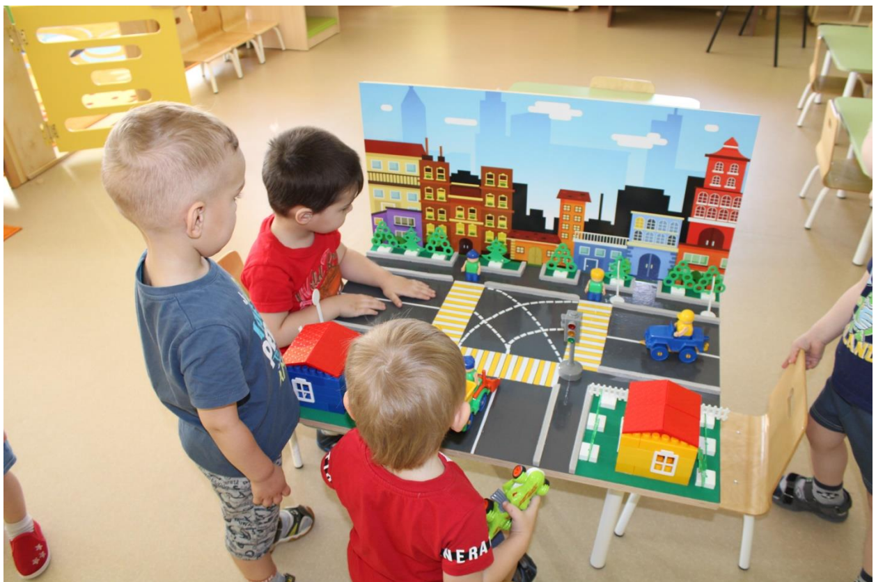
Знакомство детей с макетом.