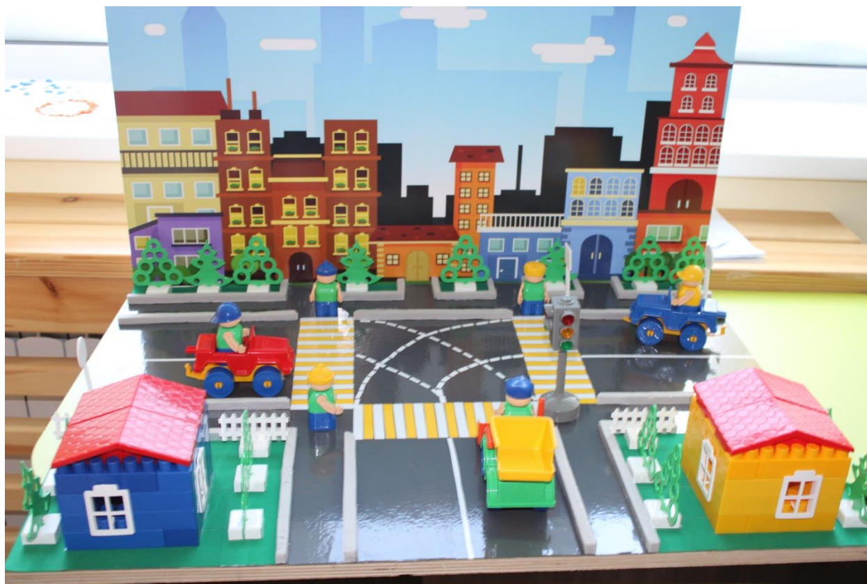
Макет перекрестка дороги.