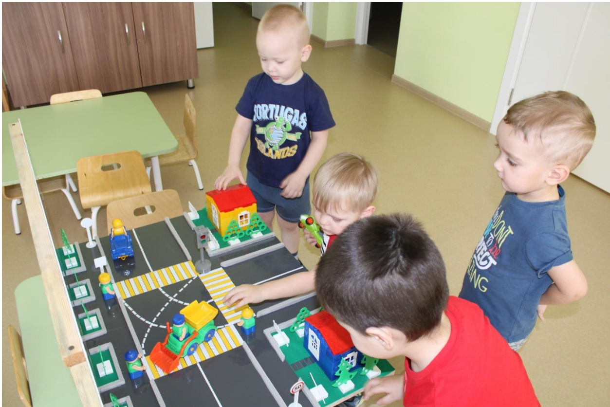
Знакомство детей с макетом.